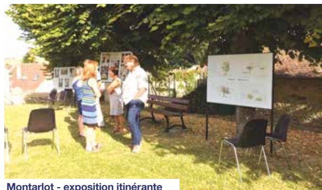
Montarlot - exposition itinérante

L'exposition itinérante des 5 es rencontres photographiques de Moret-Loing-et-Orvanne est installée dans l'espace de détente derrière la Mairie déléguée invitant le public au voyage, à la réflexion...jusqu'au 21 août. Programmation : http://moret-loing-et-orvanne.fr/rencontresphotos