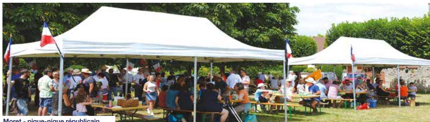
Moret - pique-nique républicain

Les panneaux de l'exposition itinérante des 5 es rencontres photographiques sont tout autour de la place de l'église et ce jusqu'au 21 août