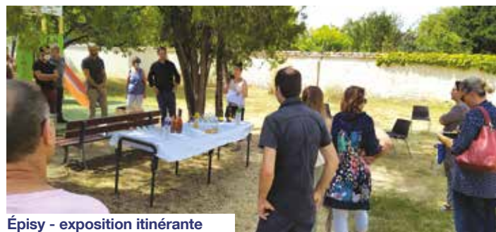
Épisy - exposition itinérante

L'exposition itinérante des 5 es rencontres photographiques de Moret-Loing-et-Orvanne est installée dans l'espace de détente derrière la Mairie déléguée invitant le public au voyage, à la réflexion...jusqu'au 21 août. Programmation : http://moret-loing-et-orvanne.fr/rencontresphotos