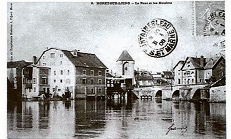
ORDONNANCE DU BUREAU DES FINANCES DE LA GENERALITE DE PARIS Pour la conservation du Pont de la Ville de Moret du 26 octobre 1779 Les Présidents - Trésoriers de France, Généraux des finances et Grands-Voyers en la généralité de Paris.