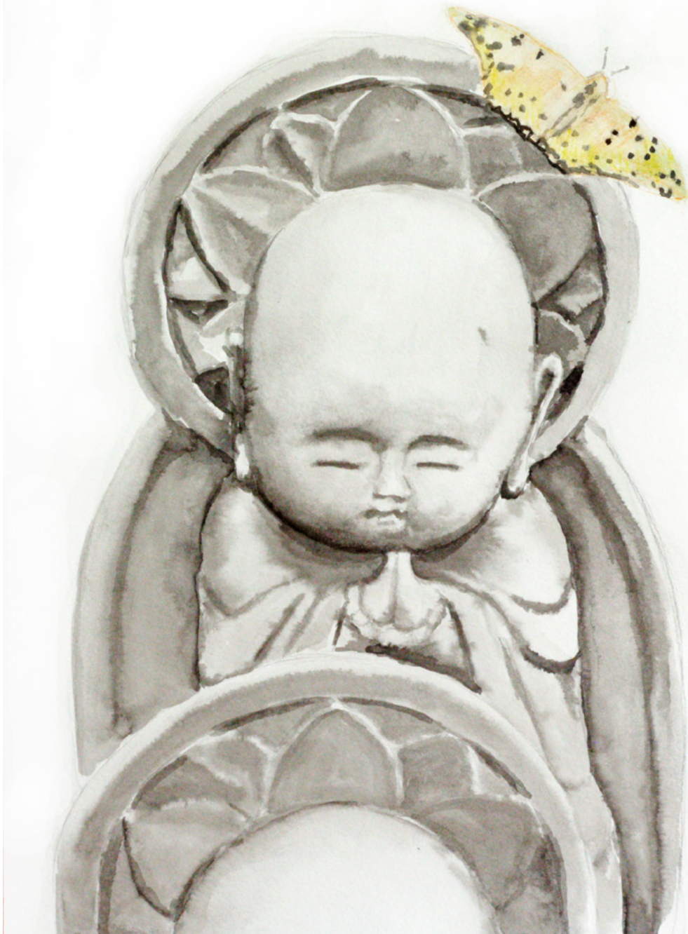
Encre de la série «Sai No Kawara» - encre et thé sur papier 40 x 30 cm - 2015 ©Nicolas Charbonnier_Jean Marc Forax