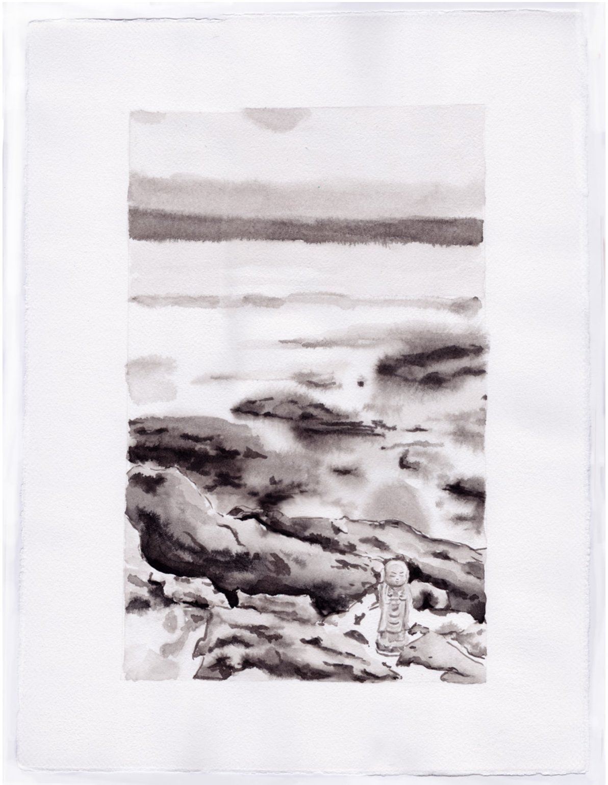
Encre de la série «Sai No Kawara» - encre et thé sur papier 40 x 30 cm - 2015 ©Nicolas Charbonnier_Jean Marc Forax