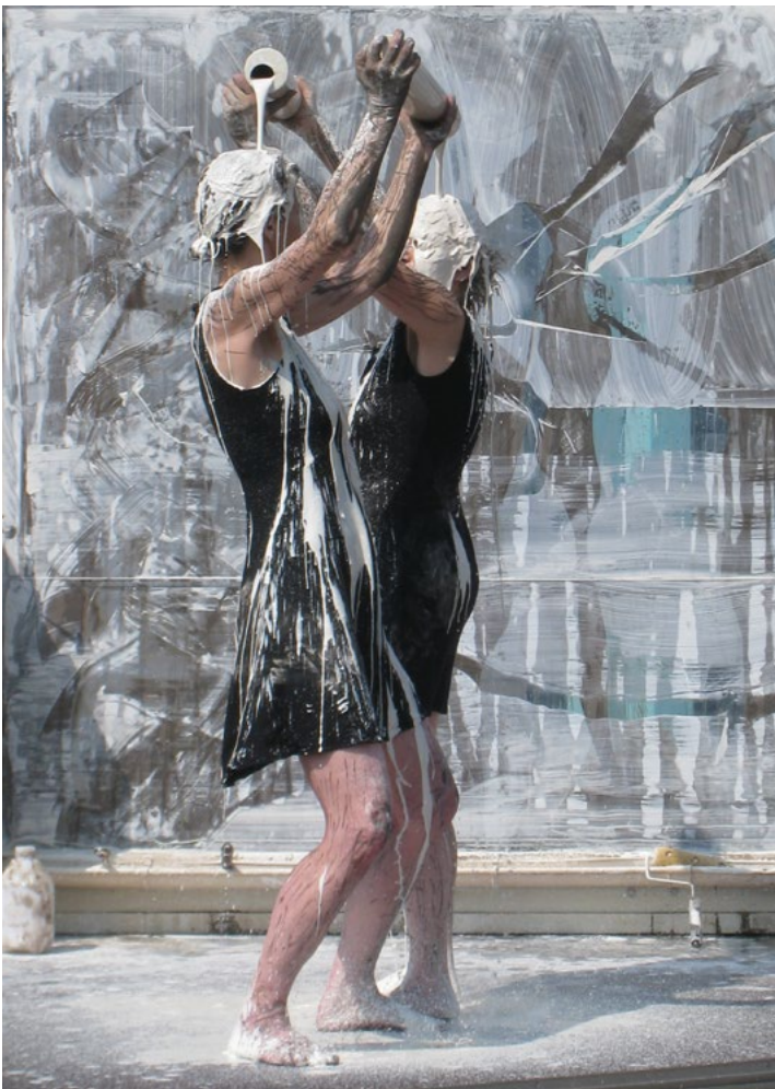
@service culturel Andenne