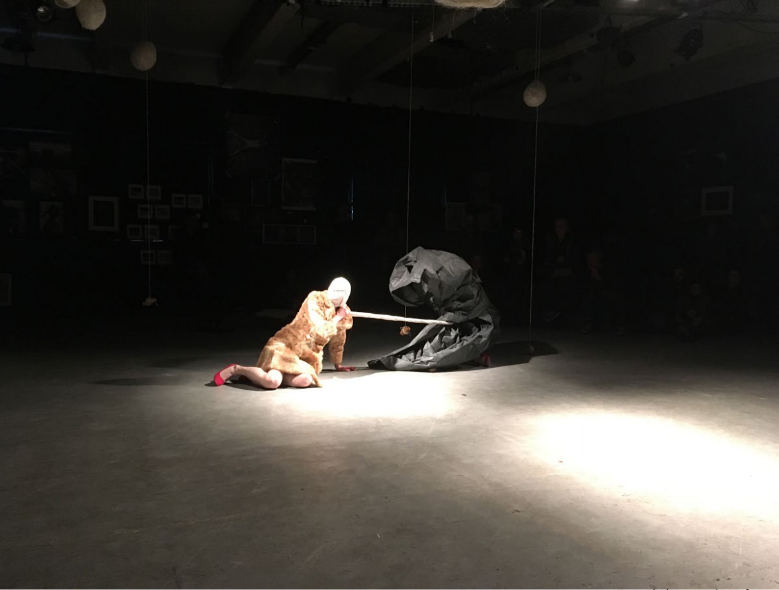
@Le Générateur pile ou frasq