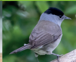
FAUVETTE À TÊTE NOIRE