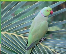
PERRUCHE À COLLIER