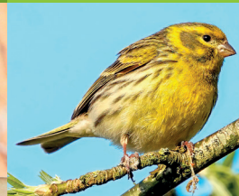
TARIN DES AULNES