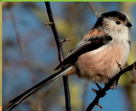
MÉSANGE À LONGUE QUEUE