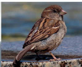
MOINEAU DOMESTIQUE ♀