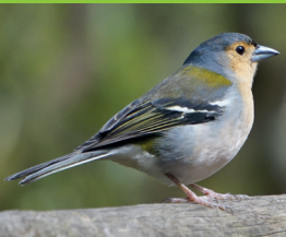
PINSON DES ARBRES ♂