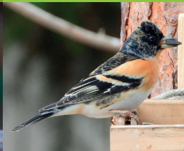
PINSON DU NORD