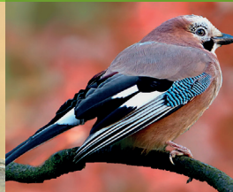
GEAI DES CHÊNES