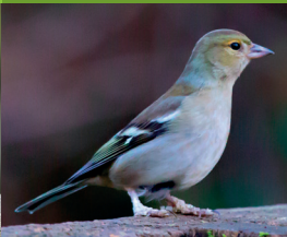
PINSON DES ARBRES ♀